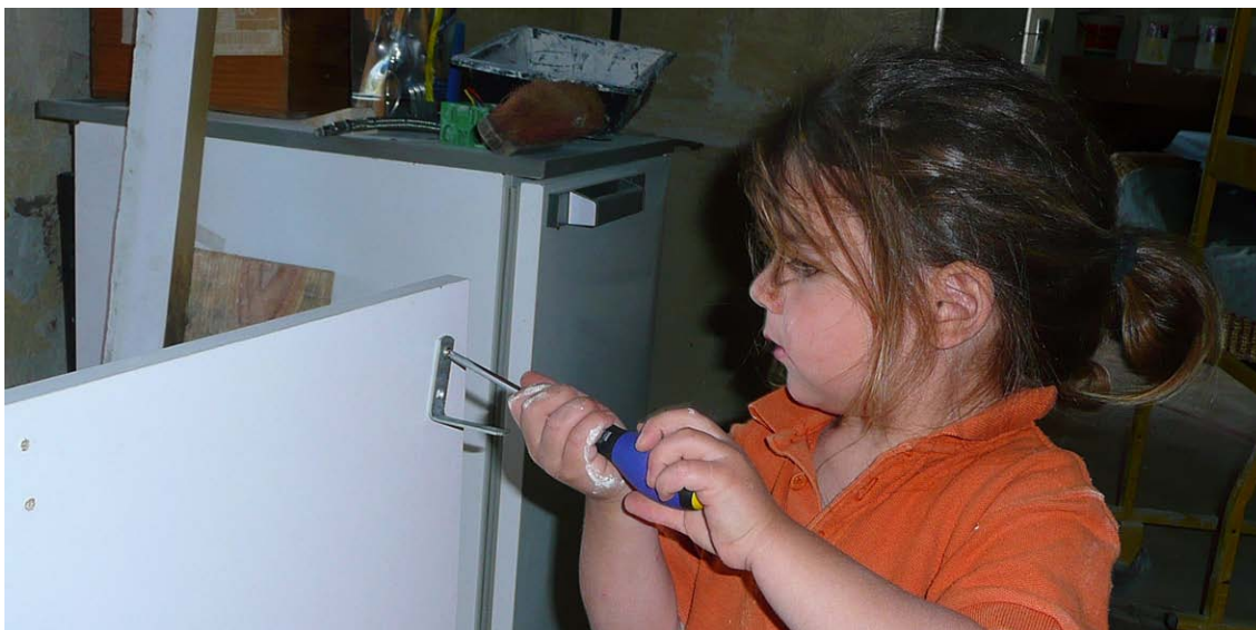
Explorer ses capacités