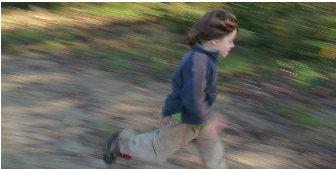
Le plaisir de sentir son corps en mouvement