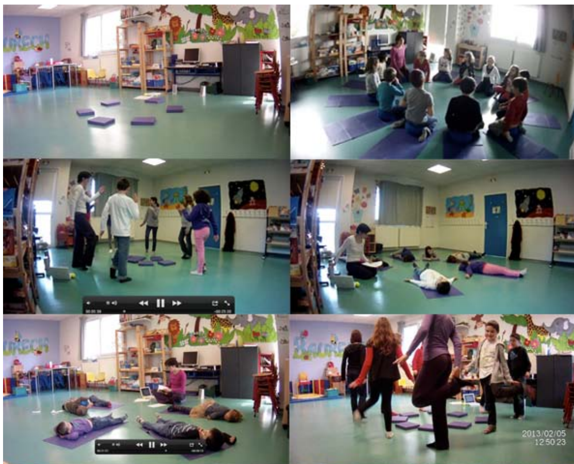
Ambiances de mes séances 3C avec des élèves de maternelle et du primaire