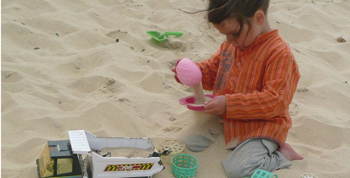
Absorbé par le jeu, présent dans l'instant